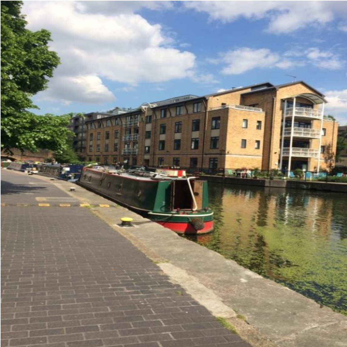
Bridgeside Lodge i Islington

Efteruddannelsesopholdet har i høj grad opfyldt vores ønsker og forventninger, og vi kan varmt anbefale andre at drage ud for at få sat sit arbejdsliv i perspektiv.